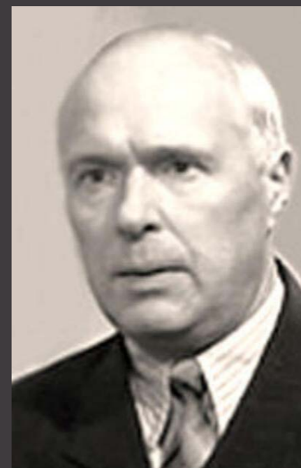
МОДЕСТ ШЕПИЛЕВСКИЙ (1906–1982)

Торжественный и величавый, ДОМ SHEPILEVSKIY академичен и выверен, аккуратно вписан в существующий архитектурный контекст, занимающий не доминирующую, а скорее лидирующую позицию.